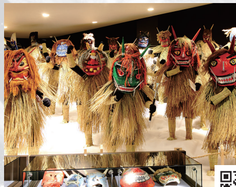
150ものナマハゲ面が勢ぞろい なまはげ館