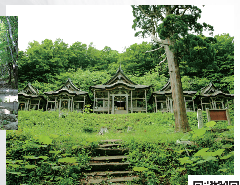
ナマハゲ伝説のパワースポット 赤神神社五社堂と九九九段の石段