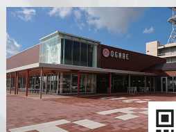
ナマハゲグッズもたくさん道の駅おが オガーレ