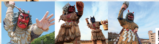
インスタジェニック男鹿にある3つの巨大なナマハゲ像