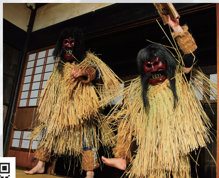
ナマハゲの迫力を間近で体験 男鹿真山伝承館