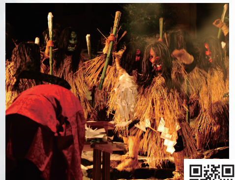
勇壮で神秘的な冬のまつり なまはげ柴灯まつり