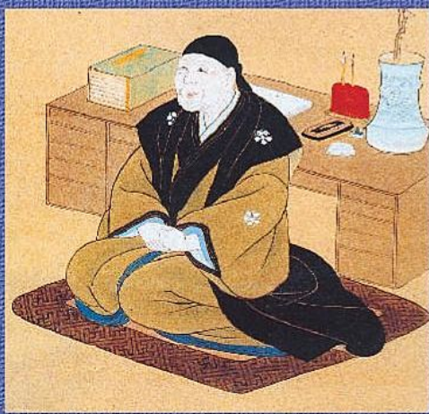
菅江真澄肖像画(能代市・杉本家蔵)

菅江真澄(1754~1829)は、江戸時代後期の紀行家で、生地である三河国(現在の愛知県東部)を旅立ち、北陸、東北、北海道を巡り歩きました。もっとも長く滞在したのは秋田で、76歳で亡くなるまで29年間を過ごしています。