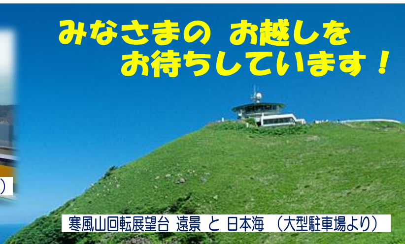
寒風山回転展望台 遠景 と 日本海 (大型駐車場より)