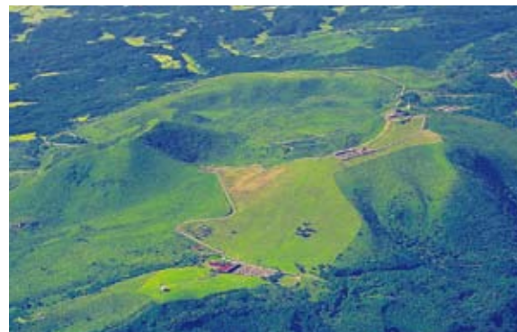
上空から見た寒風山

鬼の隠れ里 鬼たちが石を積み上げて寝泊まりしたという伝説があります。実際は粘り気の強い溶岩が噴出し、盛り上がった小山です。