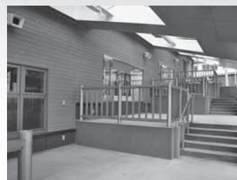
市場スペースでフリマや即売を ⑤

野外市場スペース脇には、無料の足湯・手湯コーナーが併設されています(屋外)。男鹿観光の途中でちょっと一息いれたい時などにぜひお立ち寄りください。