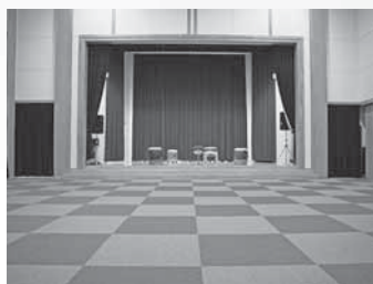
各種イベントに適したホール ①

ナマハゲふれあい太鼓ライブなどの各種イベントや会議の場はもちろん、足湯や市場スペースなどで、観光客の皆様はじめ地元の方が気軽に集まれるふれあい-交流-のスペースをご提供しております。