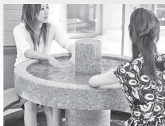
足湯コーナーでひとやすみ ④

和室は地域コミュニティや教室、小規模な会議などに適したスペースです。展示スペースではイベントにあわせた販売コーナーなども設置可能。お気軽にご相談ください。