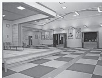
和室と展示スペース ②③

和室は地域コミュニティや教室、小規模な会議などに適したスペースです。展示スペースではイベントにあわせた販売コーナーなども設置可能。お気軽にご相談ください。